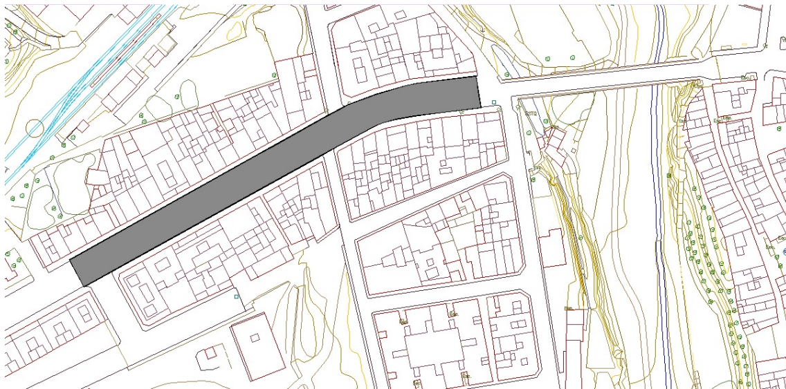
Fig.1 Àmbit d'actuació de la millora 1. / Fig.1 Ámbito de actuación de la mejora 1.

- Reposiciones y remates, enrase de pozos y arquetas, retirada de elementos para su posterior recolocación, parte proporcional de seguridad y salud y gestión de los residuos generados, quedando la actuación totalmente terminada y lista para entrar en servicio.