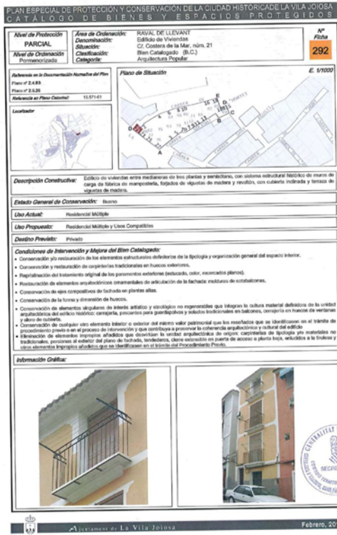
Fig. 1. Fitxa 292 del catàleg del PEPCCH.