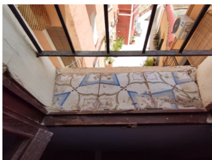
Fig. 5. Taulells antics en finestra d'escala del replà de la planta 2