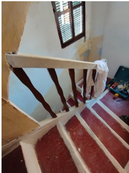
Fig. 2. Replanell de la segona planta.