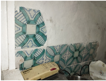
Fig. 6. Taulells antics en buit de xicotet magatzem de l'immoble

Vist l'Informe emés pel Tècnic Urbanista Municipal de 3 d'octubre de 2024 que es transcriu: