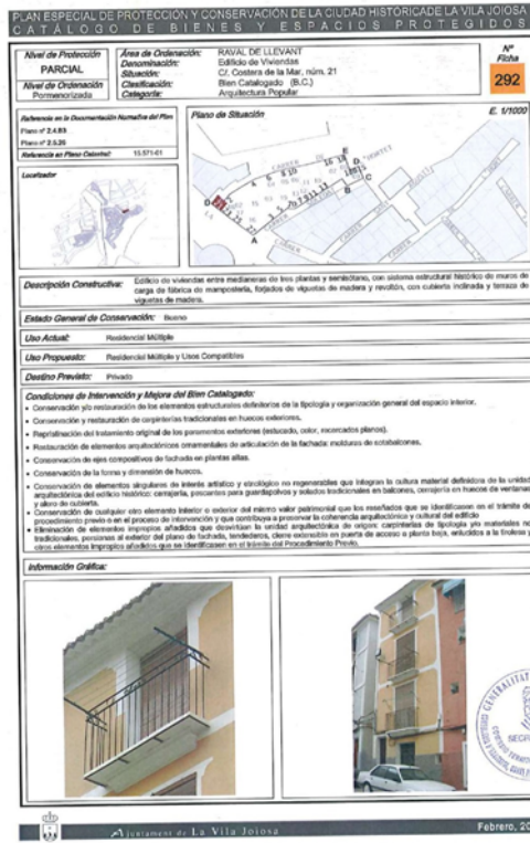
Fig. 1. Ficha 292 del catálogo del PEPCCH.