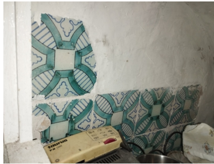
Fig. 6. Azulejos antiguos en hueco de pequeño almacén del inmueble

Visto el Informe emitido por el Técnico Urbanista Municipal de 3 de octubre de 2024 que se transcribe: