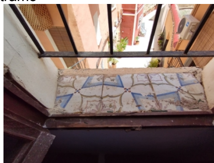
Fig. 5. Azulejos antiguos en ventana de