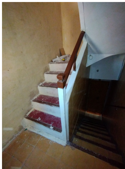
Fig. 3. Barandilla de la escalera. Primer tram.