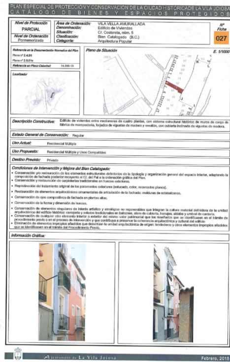
Figura 1. Ficha 27 del catálogo del PEPCCH.