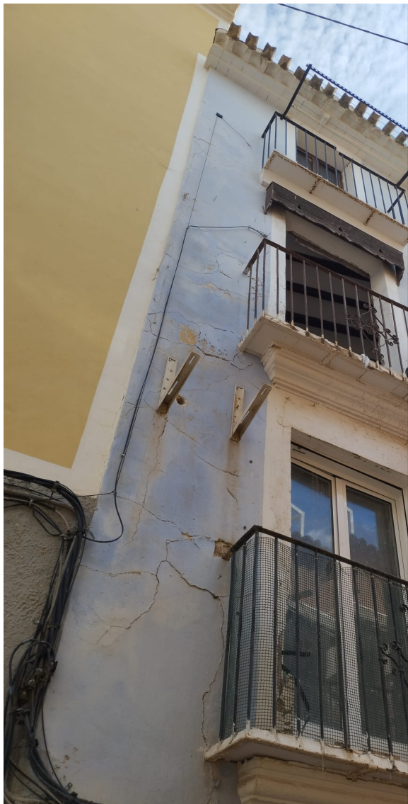
Figura 4. Vista de las plantas 1 a 3 de la fachada en C/ Costereta.