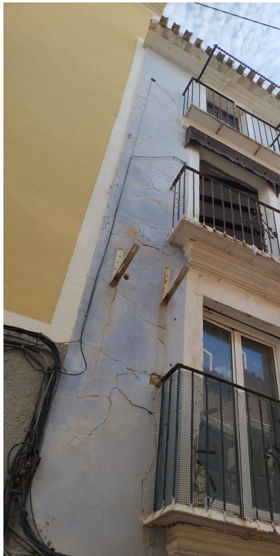
Figura 4. Vista de las plantas 1 a 3 de la fachada en C/ Costereta.

CONSIDERANT l'informe tècnic emés per l'Arquitecta Municipal en data 23.10. 2024 que, disposa: