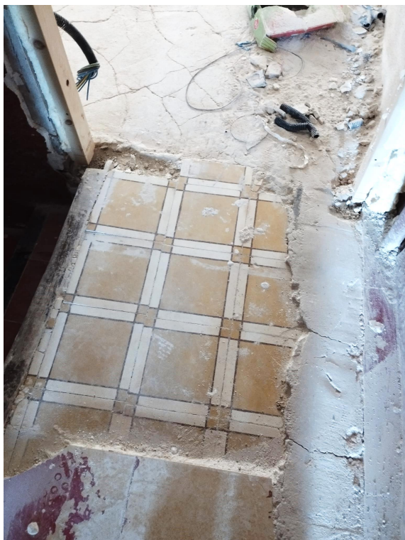
Figura 2. Pavimento de baldosas hidráulicas.